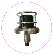
トランスデューサー