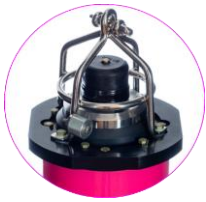
トランスデューサ